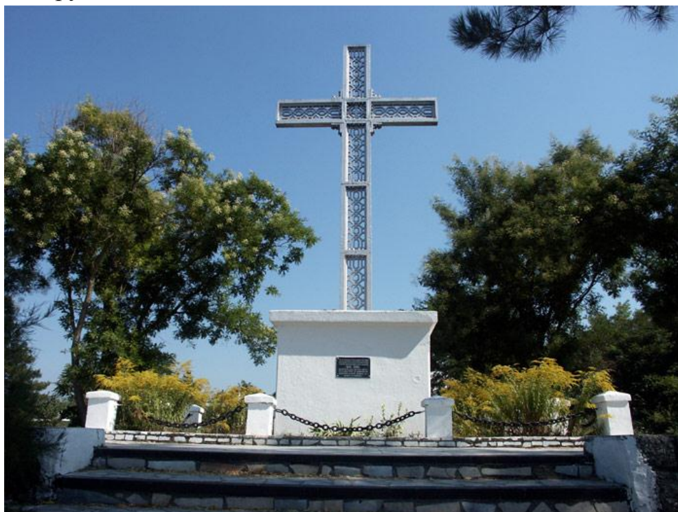
Подвиг Архипа Осипова. Михайловский пост.

много раз превосходившие по численности русский гарнизон ворвались в укрепление, защищать его уже было невозможно. И тогда рядовой Архип Осипов взрывом порохового погреба уничтожил укрепление вместе с собой, остатком гарнизона и с двумя тысячами нападавших. Государь Николай I был тронут чтением донесения об этом событии и приказал объявить об этом подвиге по всему военному ведомству, отыскать и щедро обеспечить семейство Осипова, и сверх того приказал считать на вечные времена Архипа Осипова правофланговым 1-й гренадерской роты Тенгинского пехотного полка и при переключке второй человек должен отвечать: "Погиб во славу русского оружия."